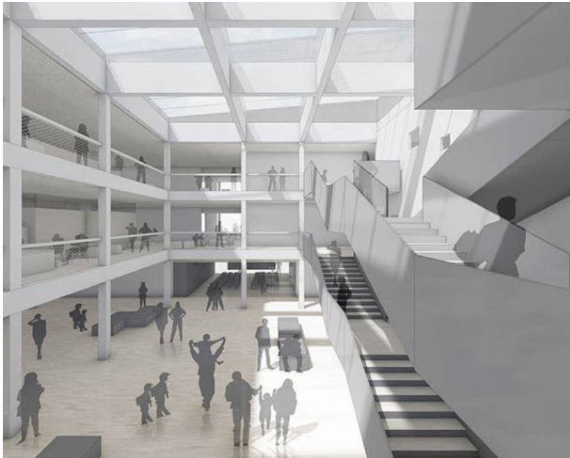
Hier eine Impression des neuen Gebäudes

Der Neubau ist ein Leuchtturmprojekt der Stadt Brühl. Mit einer modernen Ausstattung, vielen Differenzierungsräumen, großen Klassenzimmern und der neuesten Technik, wird das Lernen für die Kinder vereinfacht und das Miteinander gefördert.